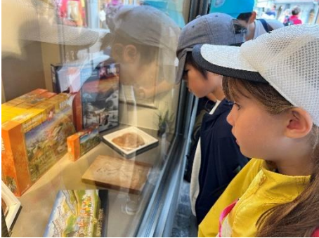
スイスの伝統菓子を調査

小学部5・6年生の総合的な学習の時間では、「伝統菓子」をテーマに学習しています。