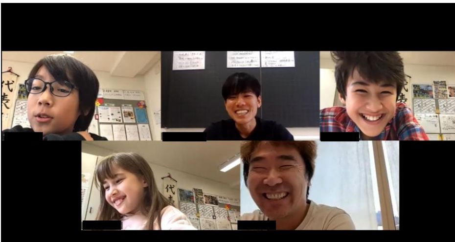
自分たちの思いや願いの実現に向けて、その道のプロにZoomで相談