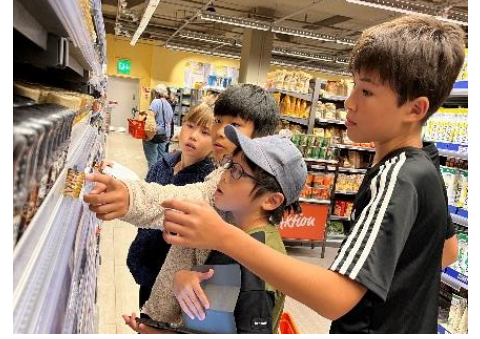
伝統菓子に入っているスパイス探し