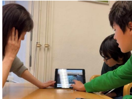
今後の活動を校長先生に相談

子供たちは、試行錯誤を繰り返し、自分たちが納得する道を探りながら活動を進めています。