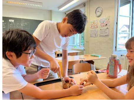
伝統菓子を食べ比べ