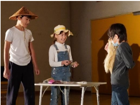
伝統菓子についての発表