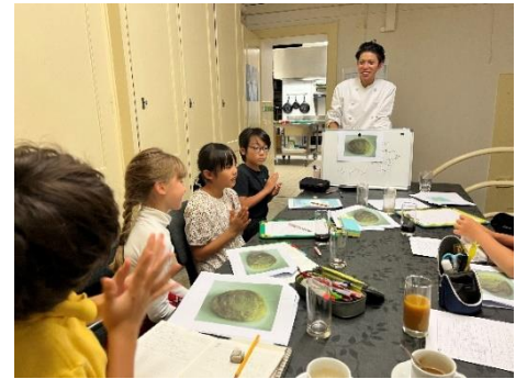
伝統菓子についての情報収集