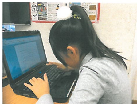
パソコン作業中の小3児童

スイスのことがたいへん詳しく丁寧に説明されています。きれいな写真もたくさん添えられています。自分が住んでいる国のことをよく知り、人に伝えることができることは、とても大切なことだと思います。