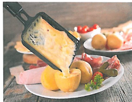
スイス名物料理「ラクレット」

⇒ スイス・ファペウアパークやスイス・ミニチュアがあります。スイスには、遊園地がありません。でも、いどう遊園地がまちに來ます。この前も、私が住んでいるウスター市に、ウスターマルクトでいどう遊園地が來ました。毎年 11 月のさいしゅう木曜日に、ウスターマルクトがあります。これは、教会のたんじょ