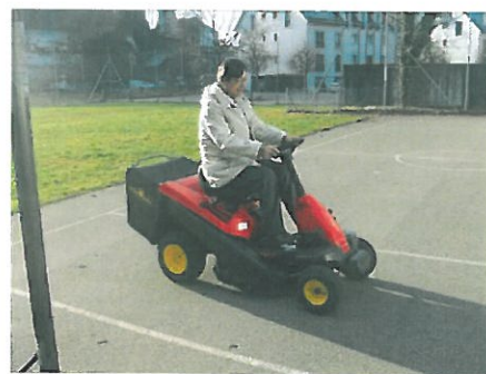
芝刈り機の乗り心地よし！

今年度の保護者主催バザーへのご協力に感謝いたします。収益金の一部をウスター市に寄付(12月7日市長訪問)し、本校には芝刈り機を寄贈していただきました。乗車しながら芝を刈ることのできるタイプで、作業効率が飛躍的に向上いたします。昨年度寄贈いただいたテントとともに、大切に使用させていただきます。ありがとうございます。