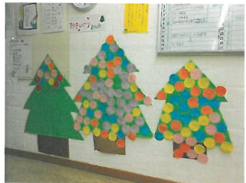
3本並んだ「おもいやりBAUM」

友達のよさを見つけられる子どもは、自分自身にもそのよさをもっています。だから、友達のよさをいっぱい見つけた子どもは、その子自身の中にも、よさがたくさんあるということです。人のよさに気づくこと、それは自分自身の中にその価値を価値として認める感性のアンテナがあるからではないでしょうか。このアンテナを子どもの頃からたっぷり育み、いろいろなことに気づいて行動することができるようになってほしいと思います。