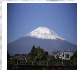
富士山の見える風景